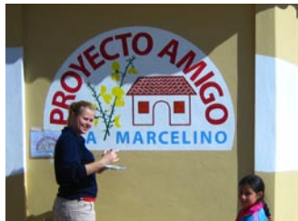
Tina maler logo