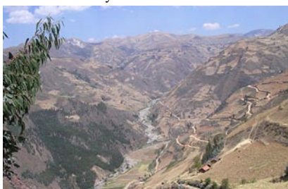
Området rundt byen