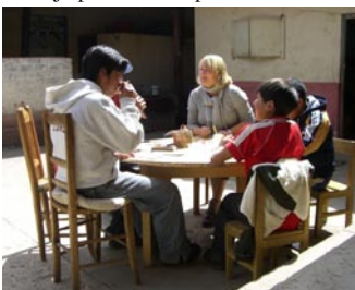
Her hjelper vi barna på Marcelino med håndarbeide som selges i Italia.